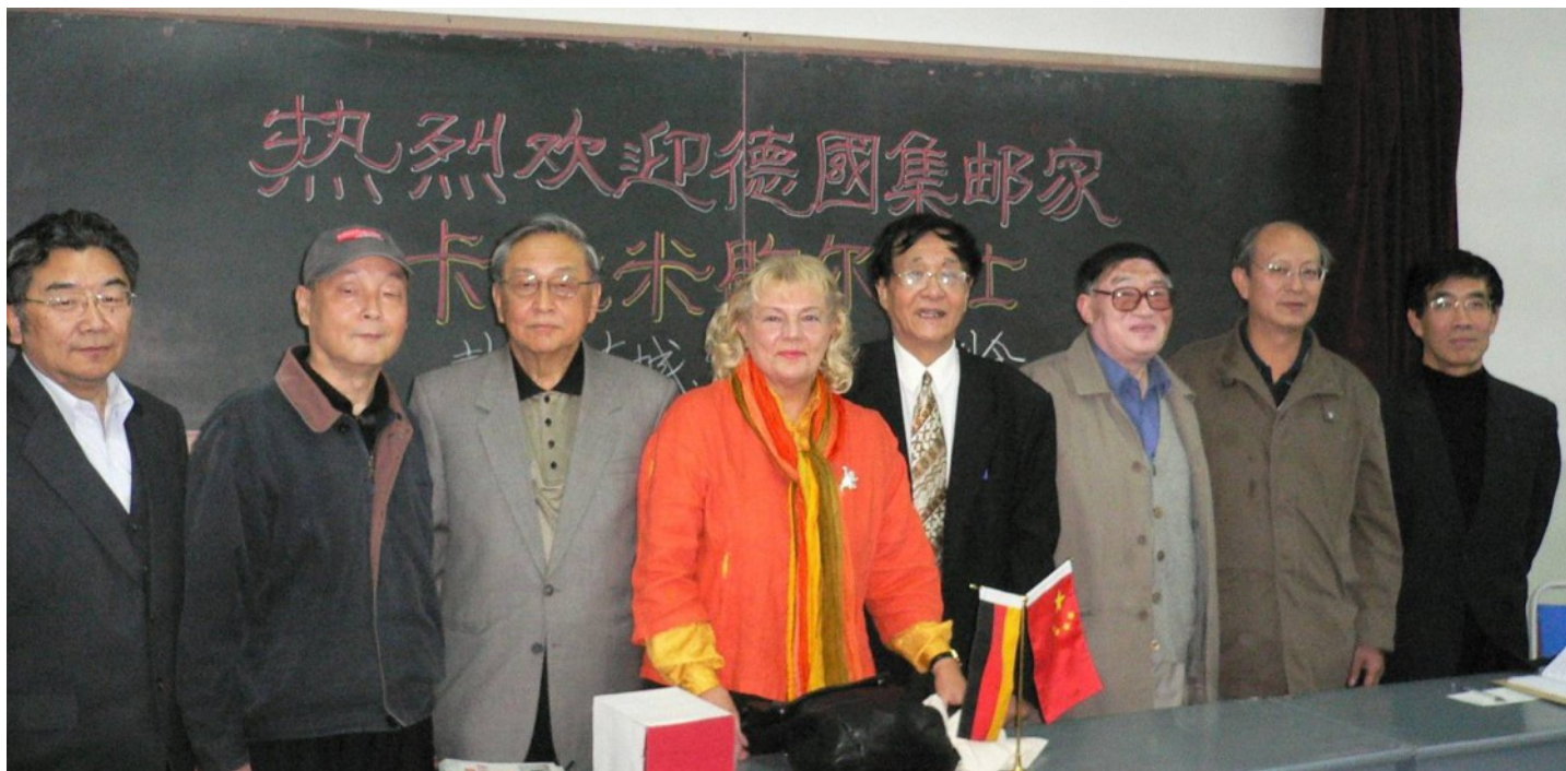
Begrüßung Ehrung, 27.10.2005